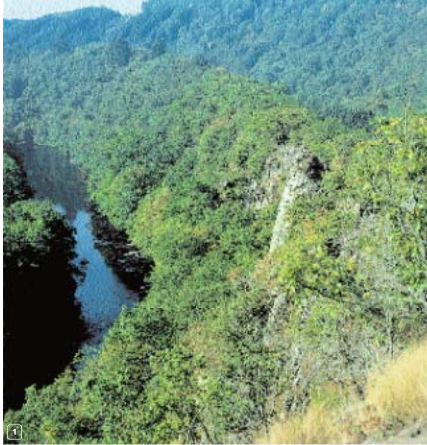
De rotskam Hérou, hoog boven de Ourthe

Zo'n afvaart van de Ourthe is op zonnige, warme dagen een bij-